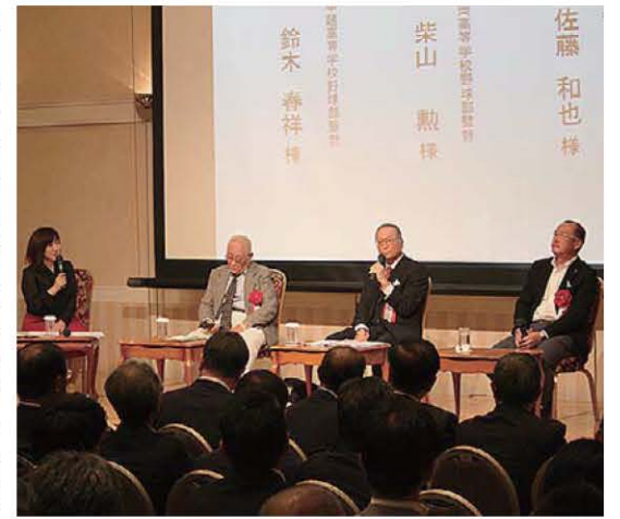
伝説の名勝負を繰り広げた3氏

「伝説の名勝負」を繰り広げた3氏によるパネルディスカッションが行われた。長岡野球の歴史を振り返り、未来への展望を語り合った。