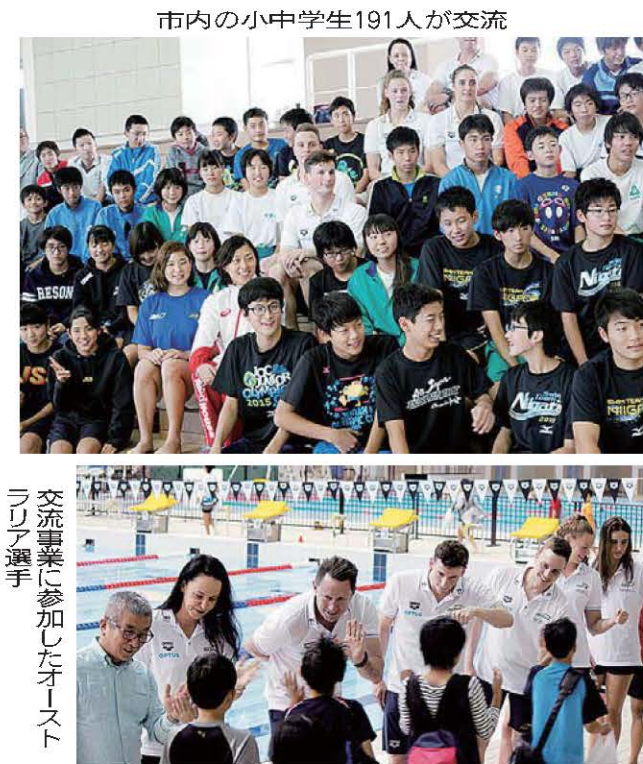
交流事業に参加したオーストラリア選手

今年3月28日、2020年東京五輪・パラリンピックに出場するオーストラリア競泳チームの事前合宿地が長岡市に決まり、市とオーストラリア水泳連盟は連携協定を結んだ。締結式の中で磯田達伸市長は「選手たちが素晴らしい成績を収めるよう、長岡市民全体でおもてなしをしていきたい」と語り、練習拠点となるのは、ダイエープロビスフエニックスプール。8月にはリチャード・コート駐日大使も視察であり、チームにとって「幸運だ」と語る。 「今回の締結はシドニー五輪の銀メダリスト中村真衣さんの存在が大きかった」と述べた。スペシャルゲストとして出席した中村真衣さんは「私にとってオーストラリアは第二の故郷。安心して長岡に来てください。市民みんなが楽しみにお待ちしています」とあいさつした。 予定されている事前合宿は以下の4大会。2018年は8月の「パンパシフィック水泳選手権(東京)」のため7月下旬から合宿。2019年は「世