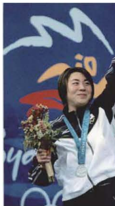
シドニー五輪の銀メダリストとして表彰台に