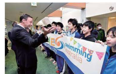
歓迎のフラッグを手にオーストラリア関係者をお出迎え

業によるスポーツの振興、③大会誘致や他種目のキャンパ誘致に向けた長岡市の知名度アップ、④オーストラリアからの観光客誘致などを期待している。世界のトップアスリートと身近で交流できるチャンスはそうそうあるものではない。今回の交流をきっかけに、スポーツだけでなく、文化・産業・経済にも広がっていくことへの期待も高まる。