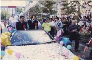
銀メダリストとしての大手通り凱旋パレード

校4年生くらいまでは楽しく通っていましたが、でも高学年になって中高生と一緒に練習するようになって、水泳を辞めたいという時期もありました。当時のコーチと本人で話し合っ、バタフライから背泳ぎに種目を変えたことが転機になりましたね」