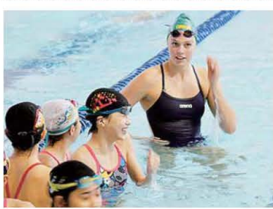
プールでも身振り手振り

◇夢づくり競泳教室 10月14日(土)、ダイエープロビスフエニックスプールを会場に、長岡市教育委員会と長岡市スポーツ協会主催の「熱中!感動!夢づくり教育」の競泳教室