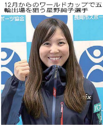
12月からワールドカップで五輪出場を狙う星野純子選手

2014年ソチ冬季五輪代表として、フリースタイルスキー女子モーグルに出場した長岡市出身の星野純子選手。来年2月の平昌五輪を目前に、12月からは出場権をかけたワールドカップも始まる。