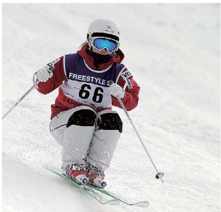
上村愛子さんの人気もあり、注目競技となったモーグル

「ソチでは緊張のあまり、その場の空気を感ずるだけで終わってしまっただけで、コーチにもうまく相談できず、問題を抱えたまま試合に臨んでしまったことに後悔が残る。でも、オリンピック独特の雰囲気を体験できた」